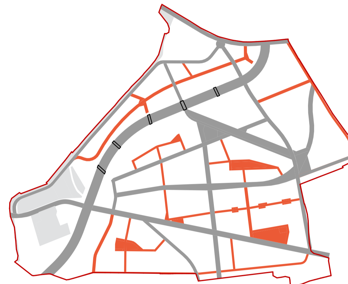
ETAPA III - EXPROPRIERI ETAPIZATE ÎN VEDEREA REALIZĂRII TRAMEI STRADALE ȘI NOULUI SPAȚIU PUBLIC ALE CARTIERULUI SOPOR