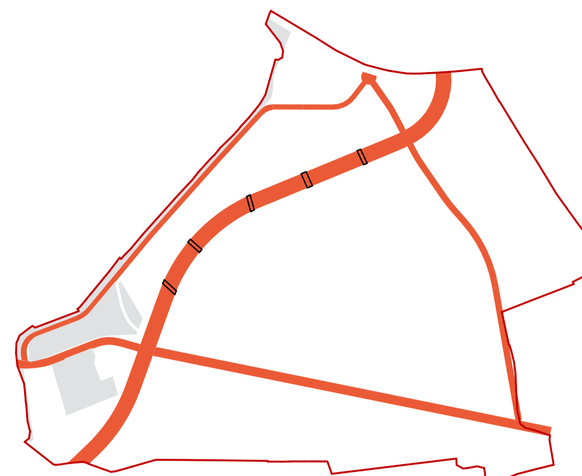
ETAPA I - REALIZAREA INVESTIȚIEI PENTRU INELUL SUDIC AL CENTURII OCOLITOARE