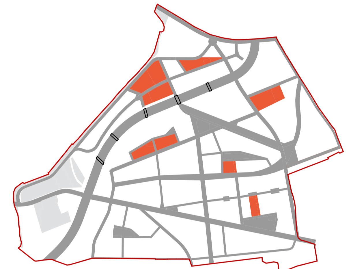
ETAPA IV - EXPROPRIERI ETAPIZATE ÎN VEDEREA REALIZĂRII TRAMEI STRADALE ȘI NOULUI SPAȚIU PUBLIC ALE CARTIERULUI SOPOR