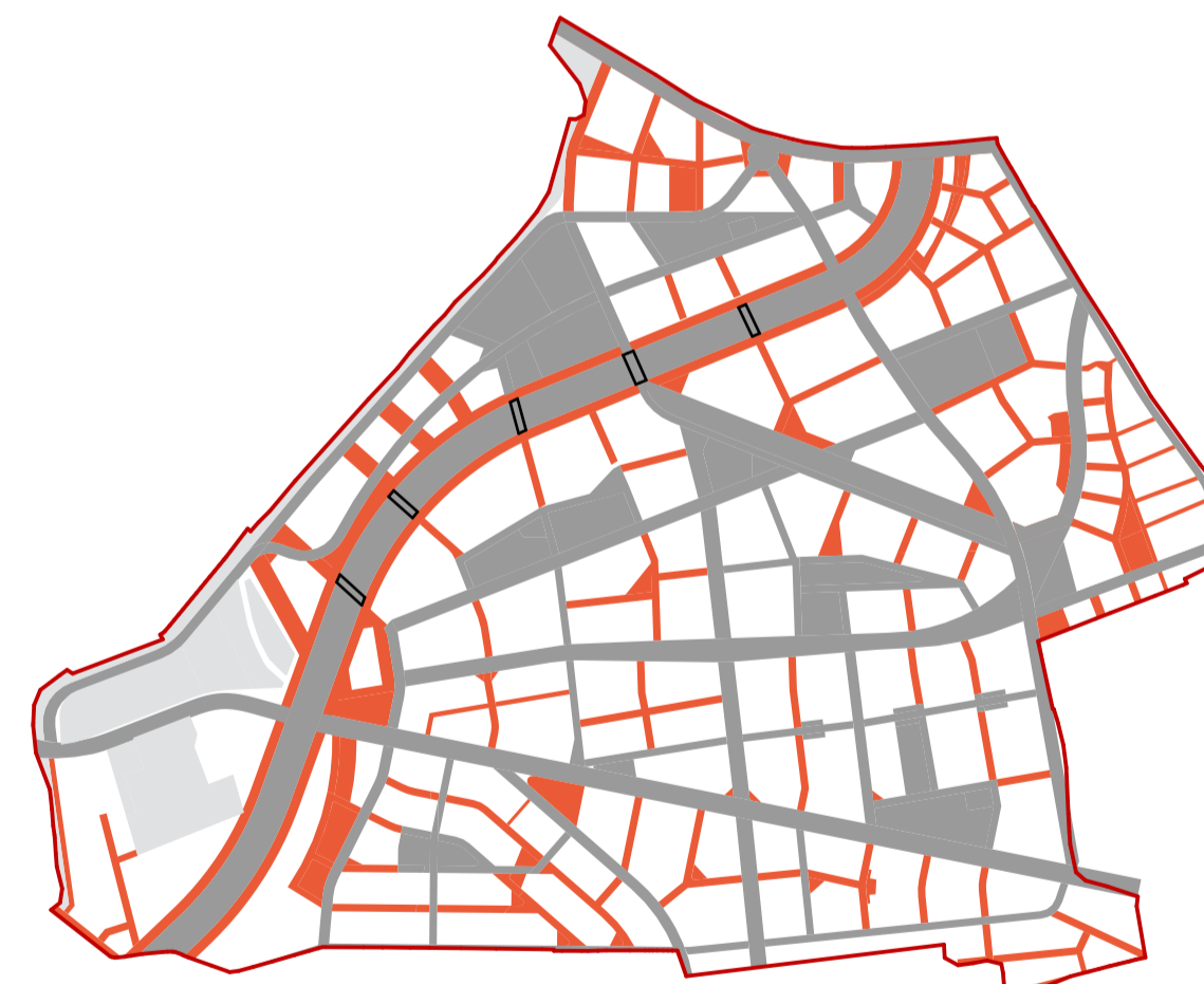
ETAPA V - EXPROPRIERI ETAPIZATE ÎN VEDEREA REALIZĂRII TRAMEI STRADALE ȘI NOULUI SPAȚIU PUBLIC ALE CARTIERULUI SOPOR