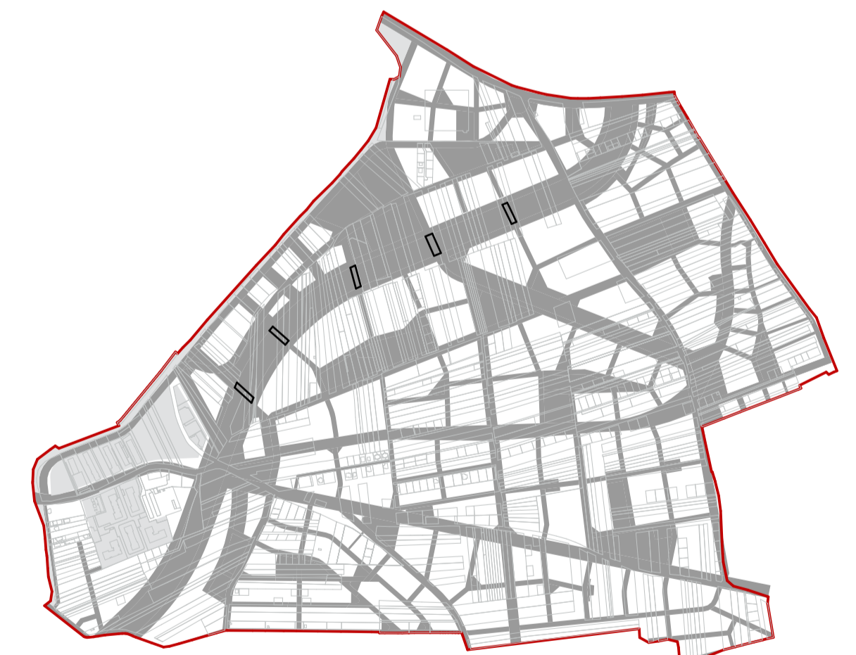
SUPRAPUNERE SPAȚIU PUBLIC PESTE PARCELARUL EXISTENT DIN CADRUL LIMITEI PUZ MASTERPLAN SOPOR