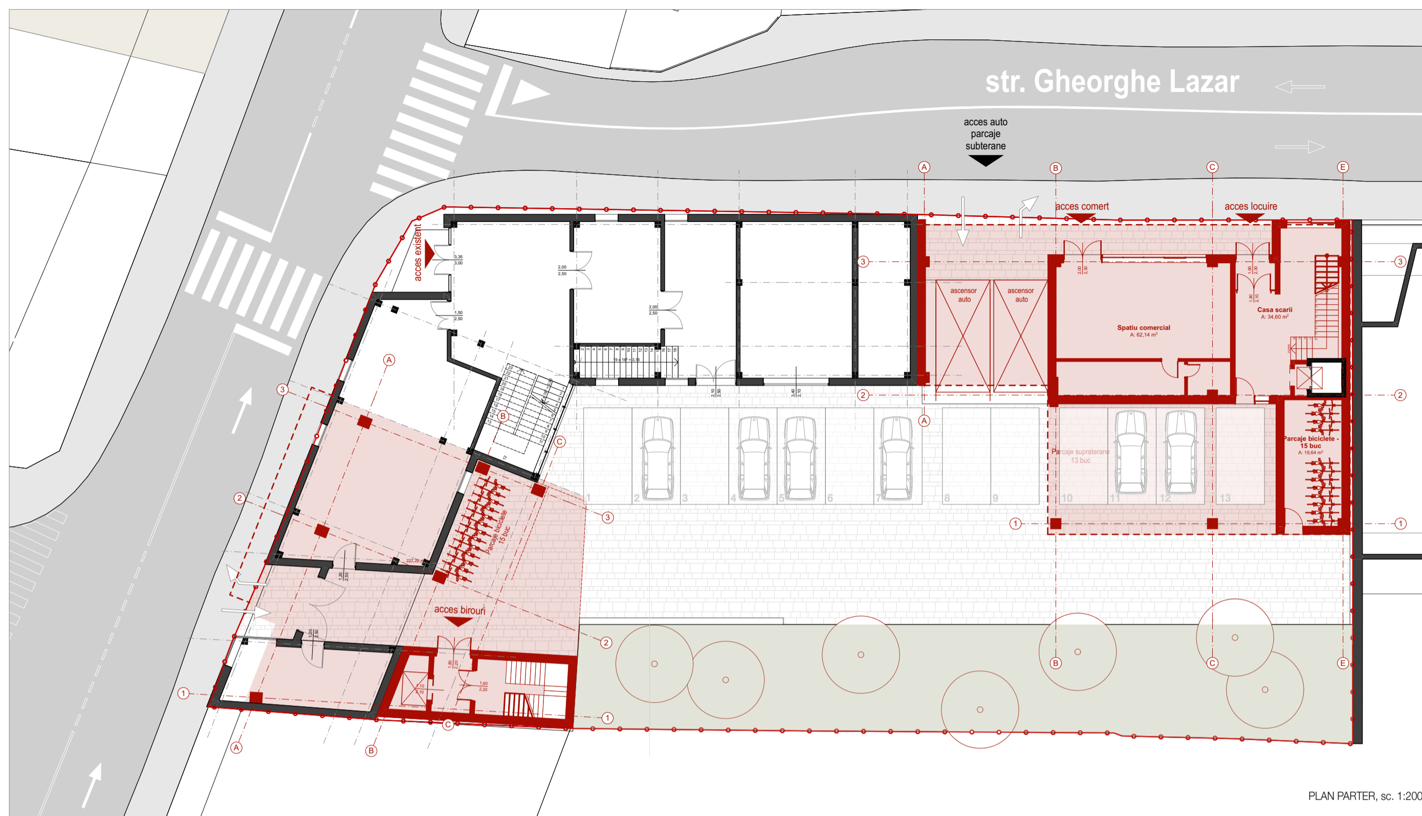
PLAN PARTER, sc. 1:200