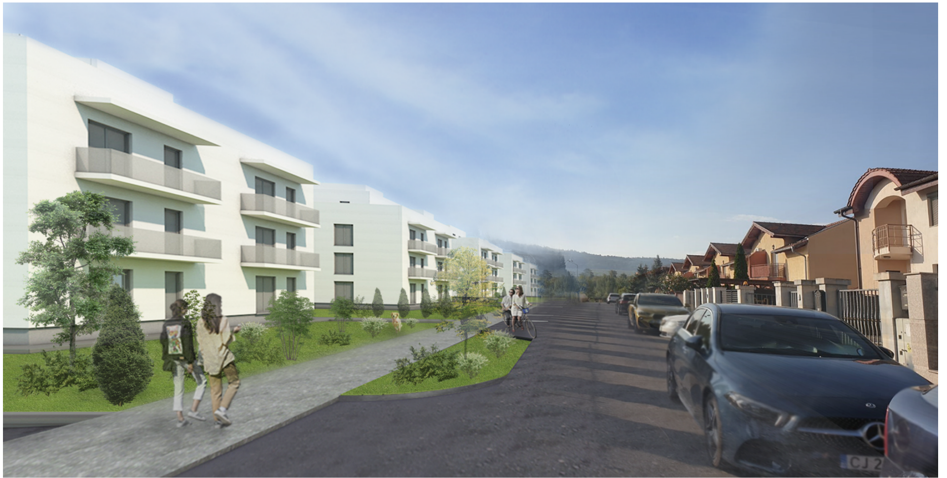
Vedere spre Sud, Str. Camil Petrescu