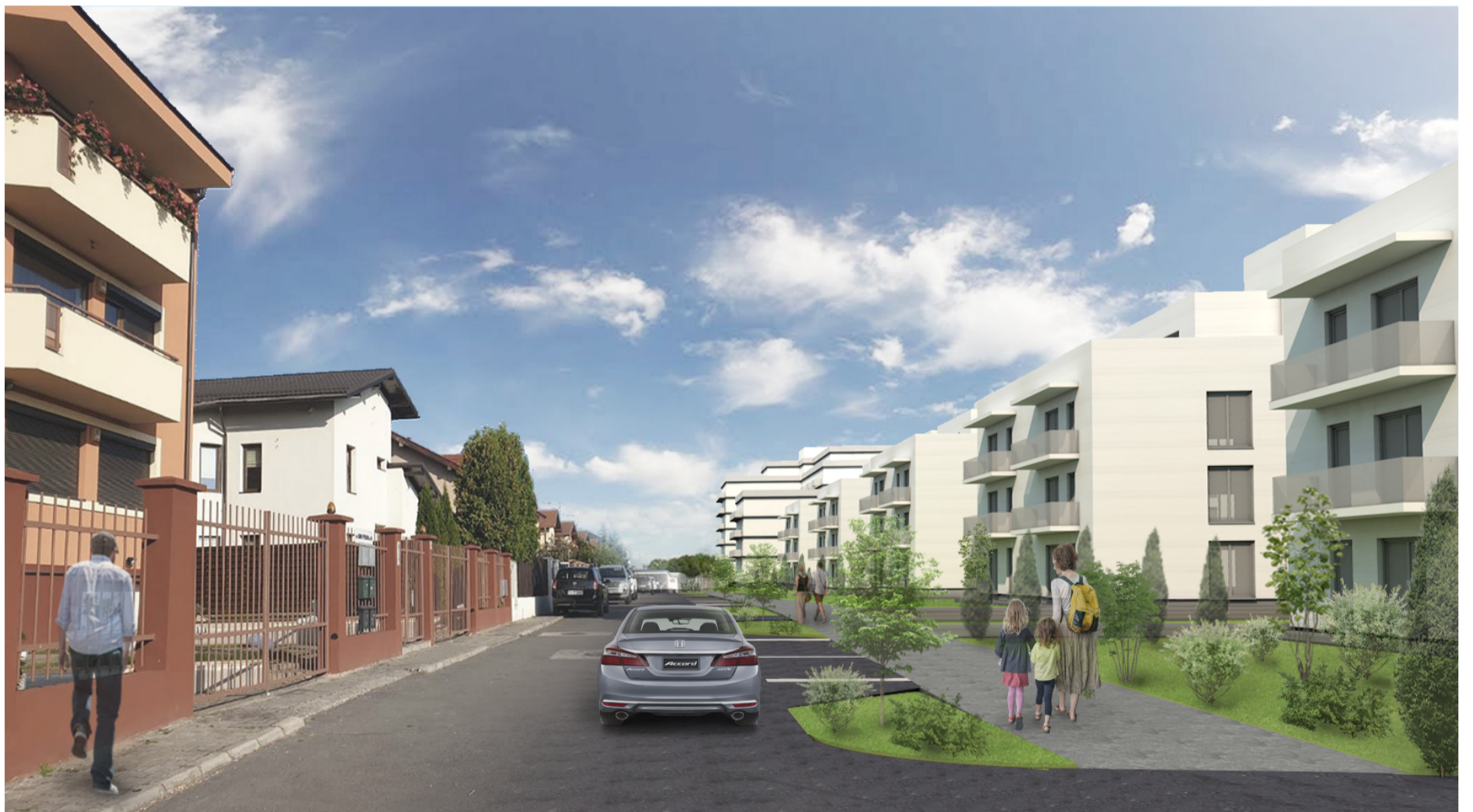
Vedere spre Nord, Str. Camil Petrescu