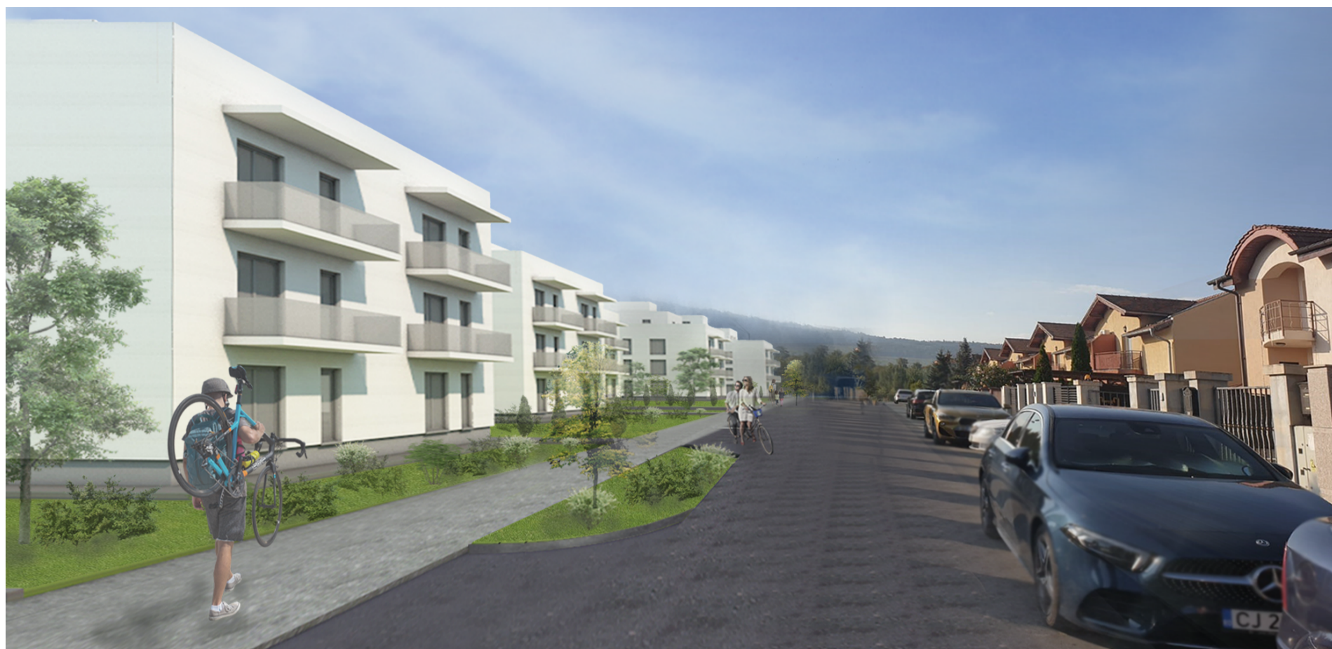
Vedere spre Sud, Str. Camil Petrescu