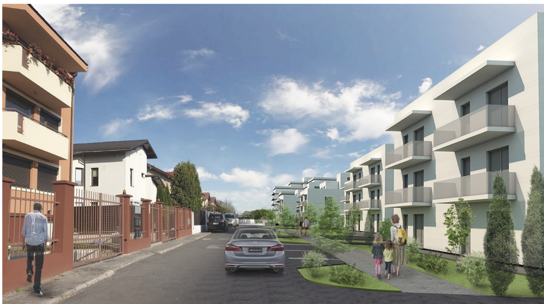
Vedere spre Nord, Str. Camil Petrescu