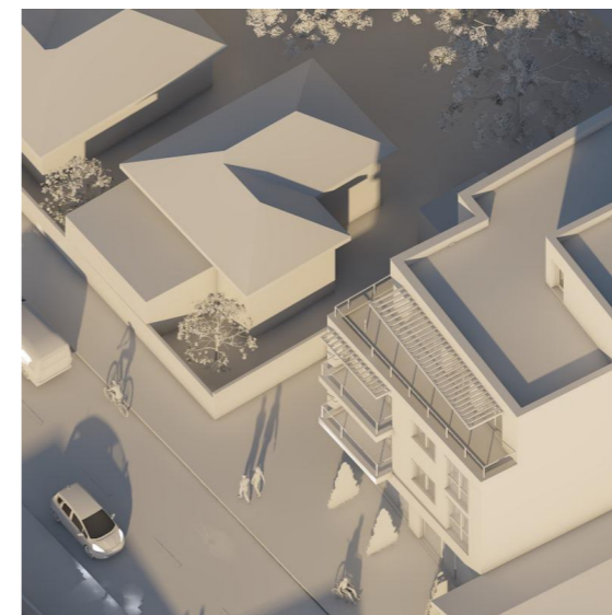
21 Decembrie - ora 11.00