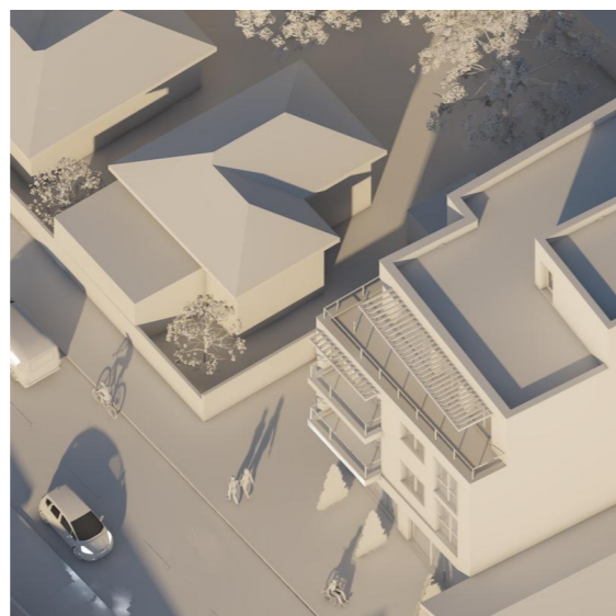
21 Decembrie - ora 12.00