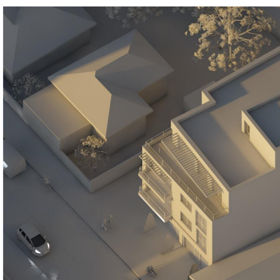
21 Decembrie - ora 15.00