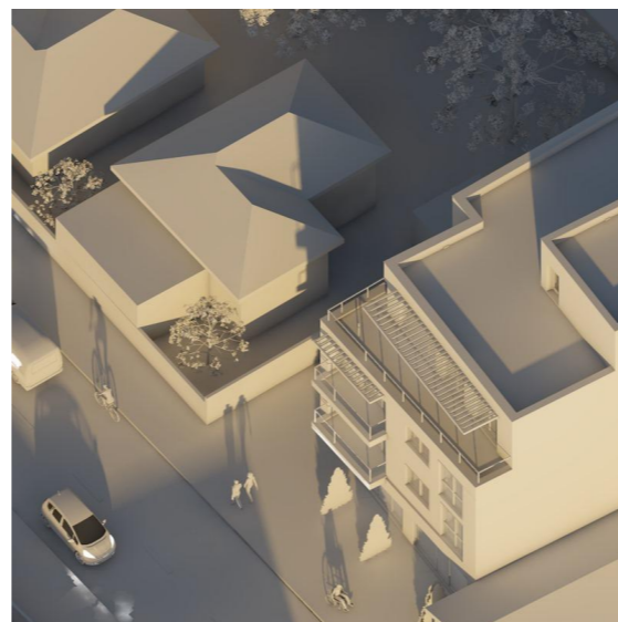
21 Decembrie - ora 10.00