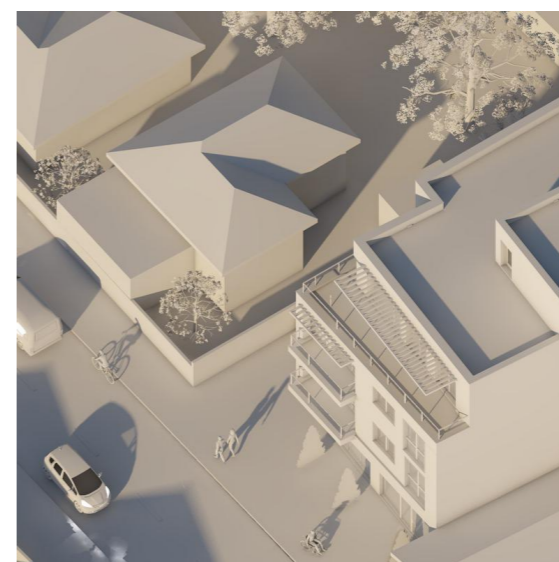
21 Decembrie - ora 13.00