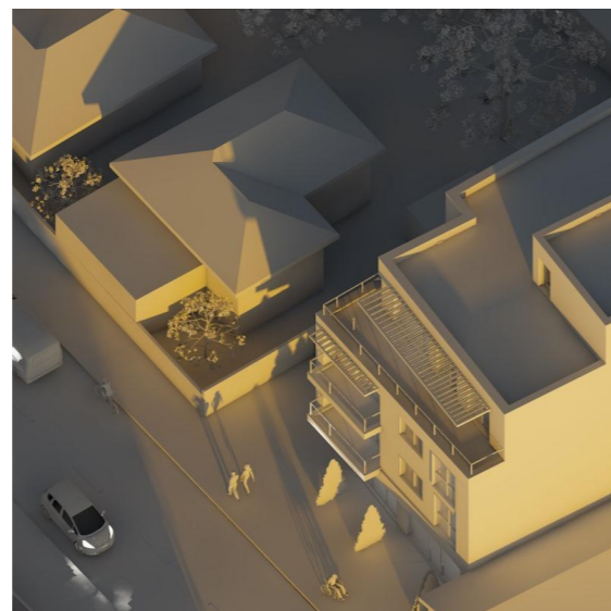
21 Decembrie - ora 9.00