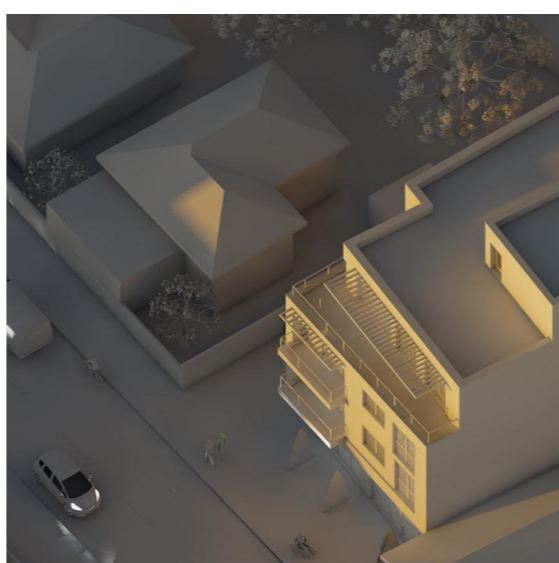
21 Decembrie - ora 16.00