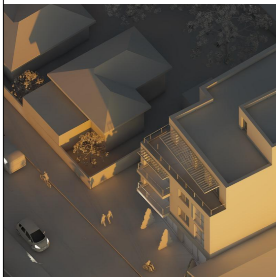
21 Decembrie - ora 8.00