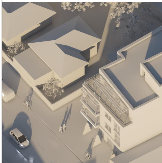
21 Decembrie - ora 11.30