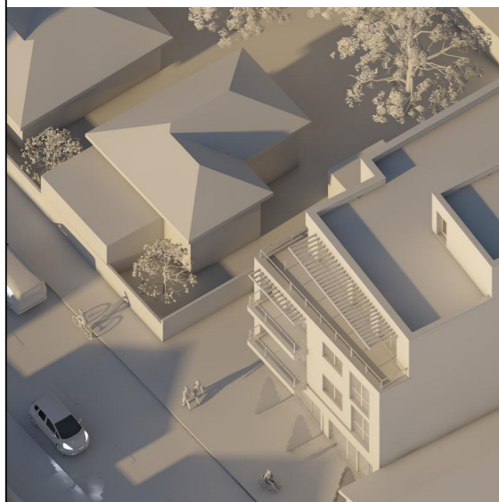
21 Decembrie - ora 14.00