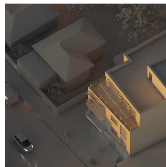
21 Decembrie - ora 16.30