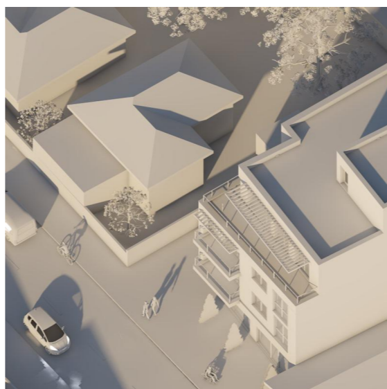
21 Decembrie - ora 12.30