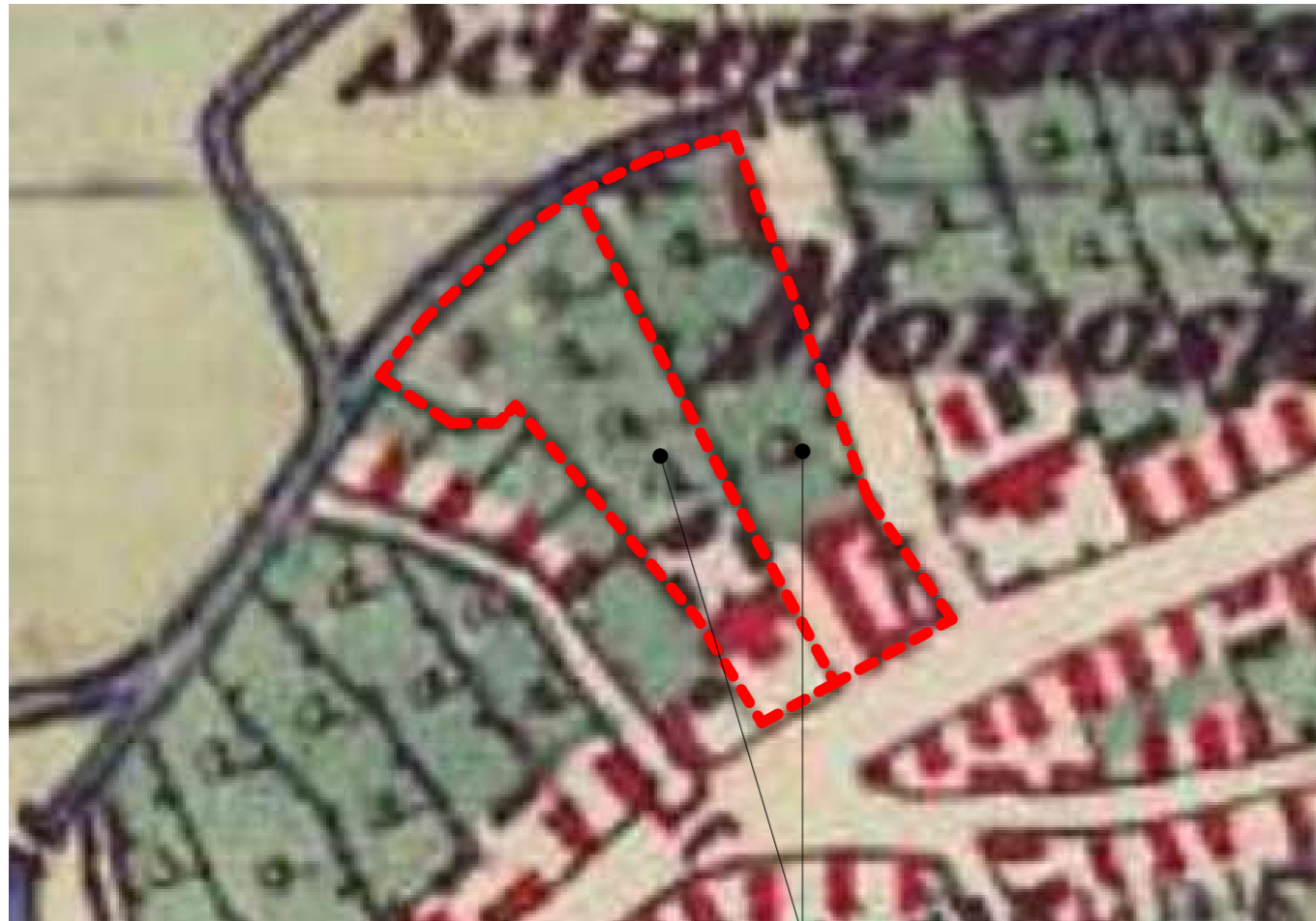
parcele lungi pe întreaga adâncime a cvartalului