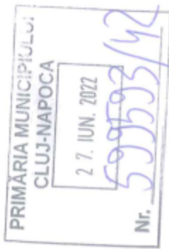
Tabel nominal elevi care au obținut media 10 la examenul de Evaluare Națională 2022

Liceul Teoretic "Nicolae Bălcescu" Cluj-Napoca, CF 4305822