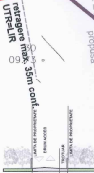
PROFIL 2-2 scara 1-250 profil drum interior de acces propus

PRIMARIA MUNICIPIULUI CLUJ-NAPOCA COMISIA TEHNICA DE AMENAJARE A TERITOR. URBANISM VIZAT HCL nr. 833 din 2 noiembrie 2022 Aviz nr 123 din 4.07.2022 SECRETAR [Signature]