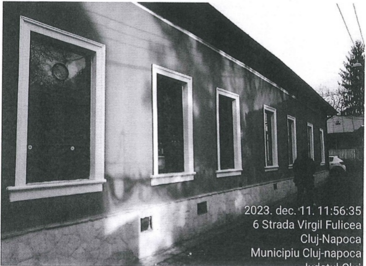
2023. dec. 11. 11:56:35 6 Strada Virgil Fulicea Cluj-Napoca Municipiu Cluj-napoca Judetul Cluj