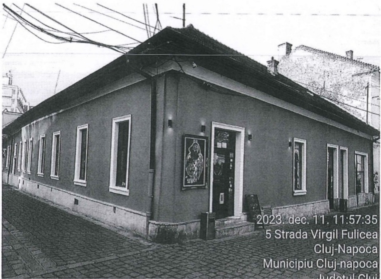
2023. dec. 11. 11:57:35 5 Strada Virgil Fulicea Cluj-Napoca Municipiu Cluj-napoca Judetul Cluj