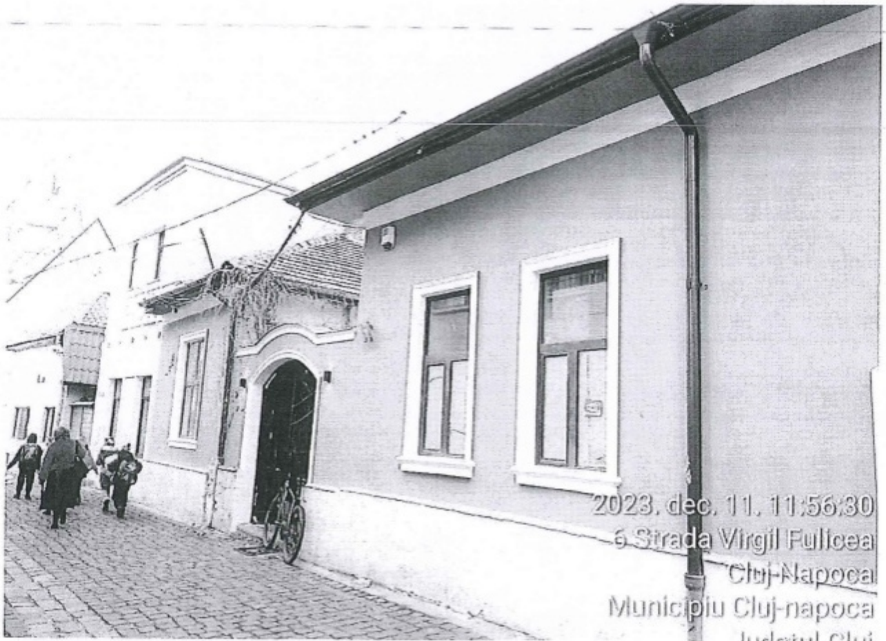
2023. dec. 11. 11:56:30 6 Strada Virgil Fulicea Cluj-Napoca Municipiu Cluj-napoca Judetul Cluj