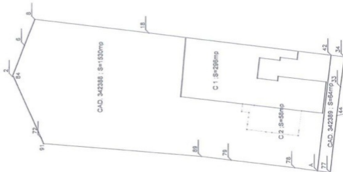
CAD. 342388 ; S=1530mp